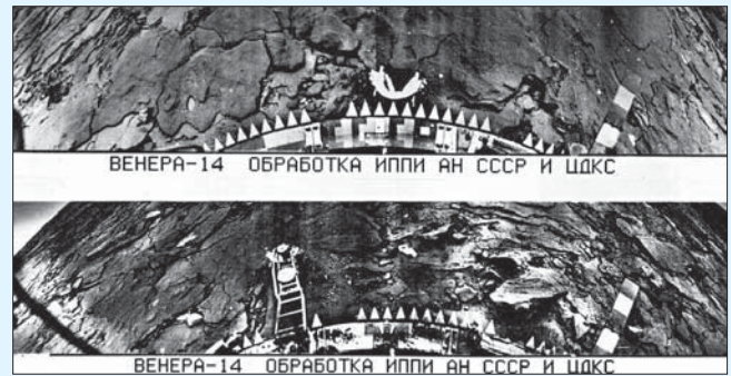
Панорамы поверхности Венеры, полученные аппаратом «Венера-14».

ют искусственные спутники Земли, говорит тот факт, что еще до запуска объекта «Д» начались подготовительные работы по лунной программе. Ниже приведем цитату из его доклада на заседании Президиума АН 14 сентября 1956 г.: