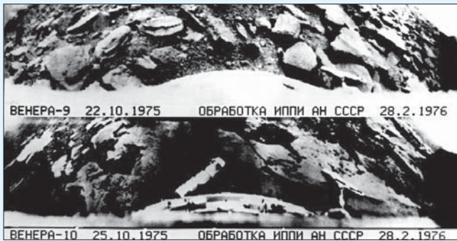
Панорамы поверхности Венеры, переданные на Землю аппаратами «Венера-9» и «Венера-10».