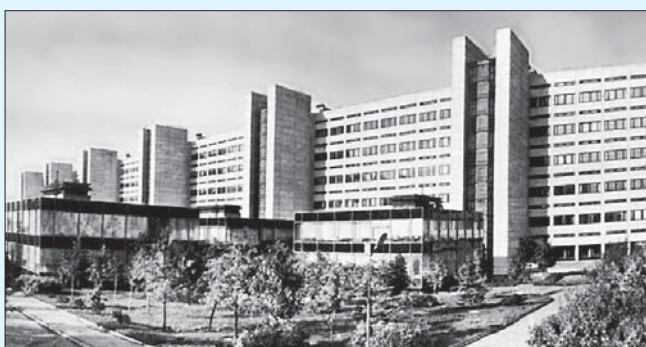
Здание Института космических исследований. Москва.

сконцентрировать усилия на нем. Такой ведущей темой стала Венера*.